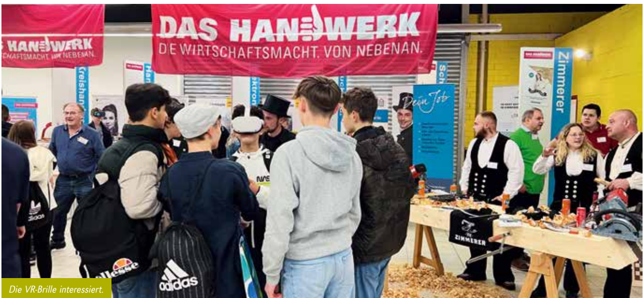
Die VR-Brille interessiert.