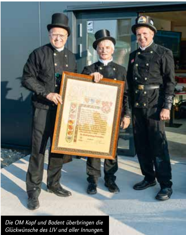
Die OM Kopf und Badent überbringen die Glückwünsche des LIV und aller Innungen.