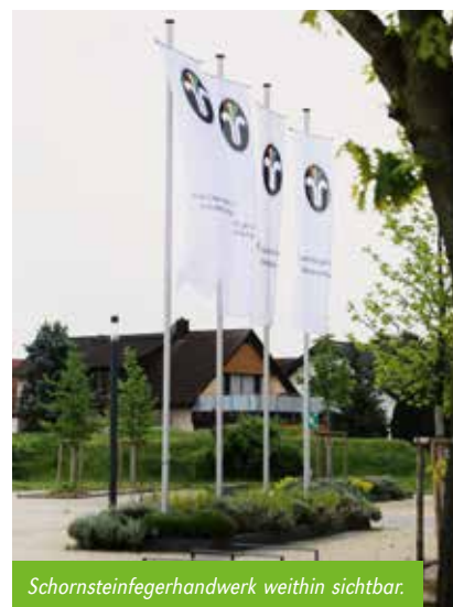
Schornsteinfegerhandwerk weithin sichtbar.

Am 9. Mai 2023 fand erstmals die Innungsversammlung in der Waldseehalle des Alex-Huber-Forums in Forst statt. Dieser Ortswechsel wurde noch unter Obermeister Jürgen Braun 2019 angegangen und dann coronabedingt aufgeschoben. Nach eingehenden Abwägungen im Innungsvorstand über Kosten, Vorteile und Möglichkeiten fiel der Beschluss für Forst. Die Entscheidung für Forst stellt eine gewisse Erneuerung der Innungsversammlungen dar. Das moderne Erscheinungsbild der Räumlichkeiten, die neu aufgeteilte Ausstellung und die neue Art der Verpflegung sollen die Innungsversammlungen für alle Beteiligten wieder attraktiver machen. Wenige Wochen nach der Innungsversammlung ist der Vorstand der Ansicht, dass die Premiere in Forst durchaus gelungen ist. An kleinen Stellschrauben des kontinuierlichen Verbesserungsprozesses wird selbstverständlich noch nachjustiert werden.