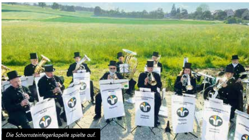
Die Schornsteinfegerkapelle spielte auf.

Er pflegt schon seit vielen Jahren mit sehr viel Herzblut und großem persönlichen Einsatz diese Sammlung.