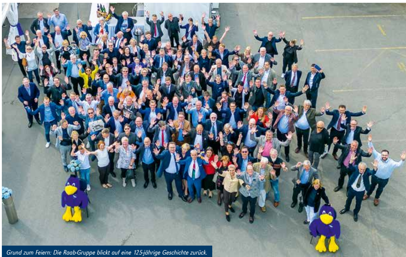
Grund zum Feiern: Die Raab-Gruppe blickt auf eine 125-jährige Geschichte zurück.

Durch den Kauf der Kutzner + Weber GmbH wurde das Unternehmen 1997 zur Raab-Gruppe. Kutzner + Weber war zu der Zeit bereits für seine abgastechischen Schornsteinkomponenten – wie Abgasklappen und Zugbegrenzer – bekannt, die schon damals der Energieeinsparung und der Effizienzsteigerung des Heizsystems dienten. In Zeiten von Energieknappheit sind sie