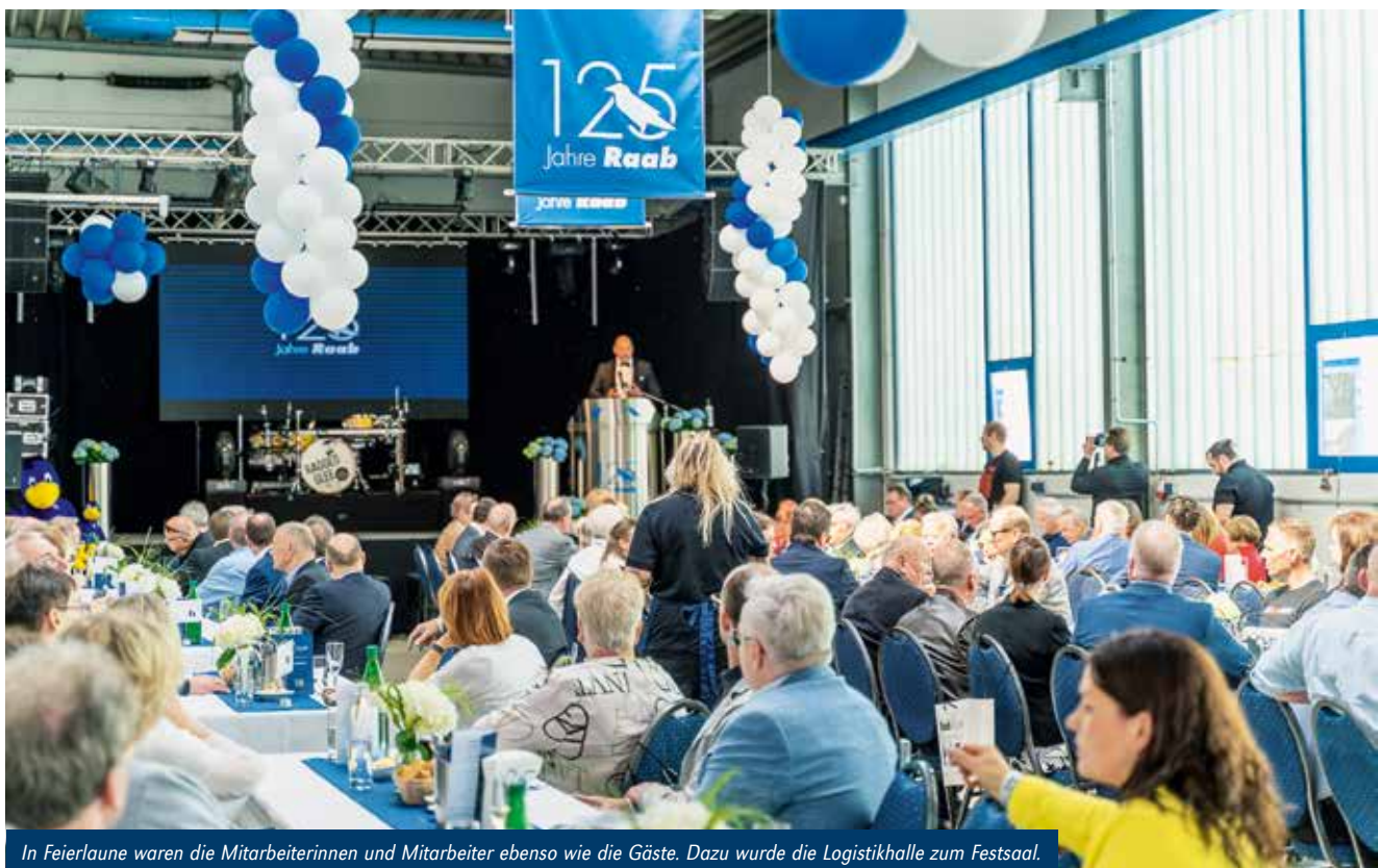
In Feierlaune waren die Mitarbeiterinnen und Mitarbeiter ebenso wie die Gäste. Dazu wurde die Logistikhalle zum Festsaal.