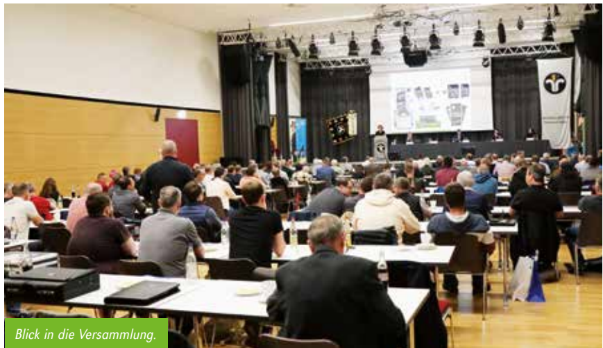
Blick in die Versammlung.