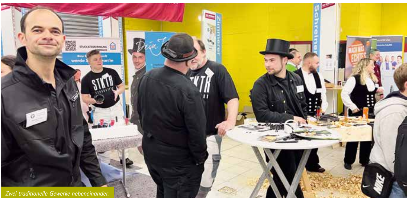
Zwei traditionelle Gewerke nebeneinander.