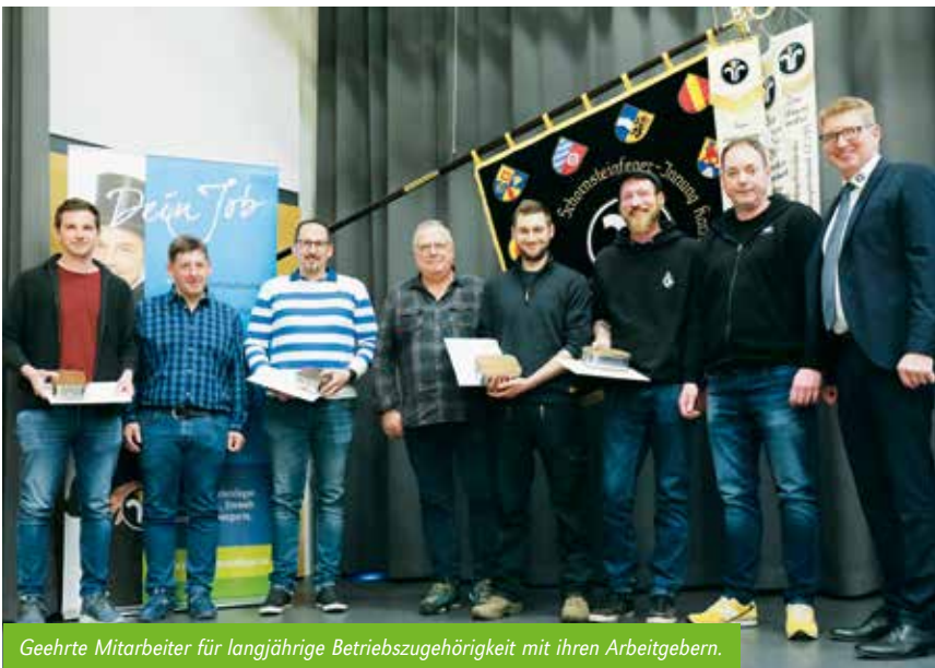
Geehrte Mitarbeiter für langjährige Betriebszugehörigkeit mit ihren Arbeitgebern.