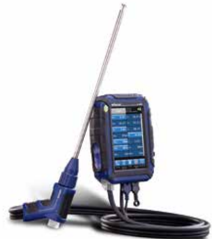
Modernes Abgasmessgerät mit großem Touch-Display: Wöhler A 450.

Zahlreiche Schornsteinfeger/innen messen inzwischen fast ihr ganzes Berufsleben lang mit einem Wöhler-Gerät und haben auch von Anfang an denselben Ansprechpartner bei Wöhler. Viele Wöhler-Mitarbeiter sind nämlich schon seit Jahrzehnten dabei, teilweise 40 Jahre und länger. Beim Jubiläumsfest wurden aber auch zahlreiche junge neue Mitarbeiter begrüßt, auf die schon eine ganze Reihe von Aufgaben warten. Aufgrund der jetzigen Klima- und Energiekrise sind Schornsteinfeger/innen nämlich mehr denn je gefragt. Entsprechend stehen auch bei Wöhler für die Zukunft jede