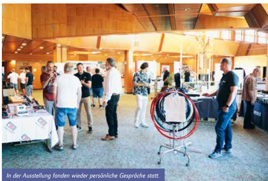
In der Ausstellung fanden wieder persönliche Gespräche statt.