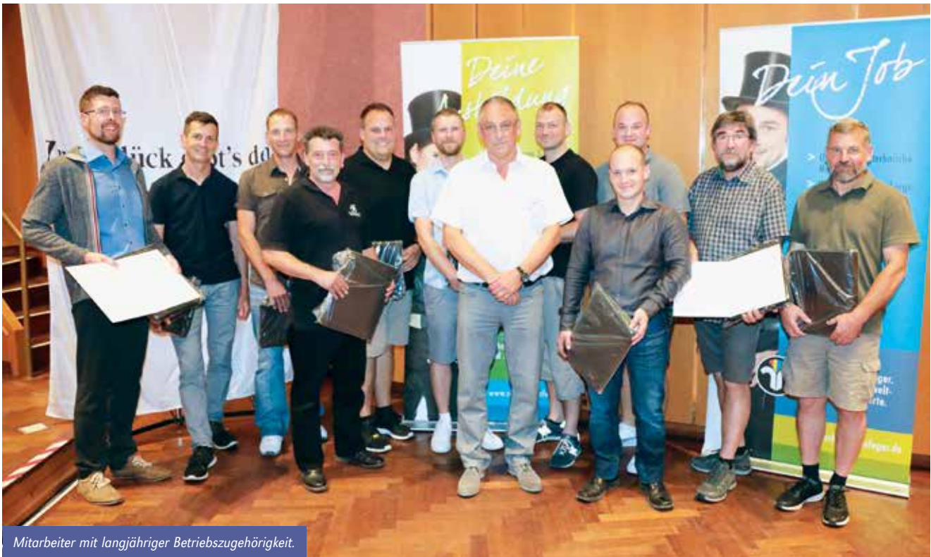
Mitarbeiter mit langjähriger Betriebszugehörigkeit.