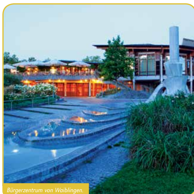
Bürgerzentrum von Waiblingen.