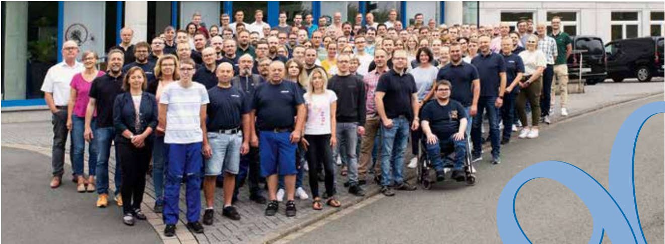
Die Belegschaft der Wöhler Technik GmbH heute.