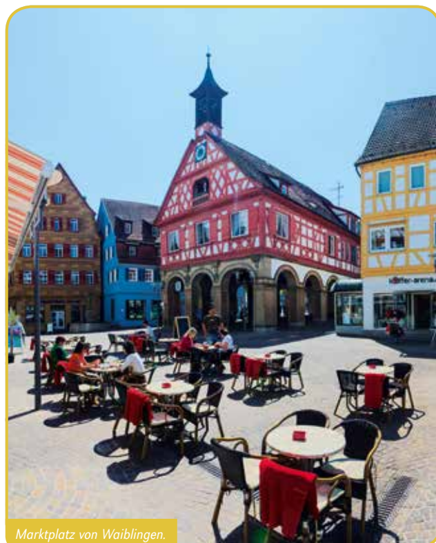
Marktplatz von Waiblingen.