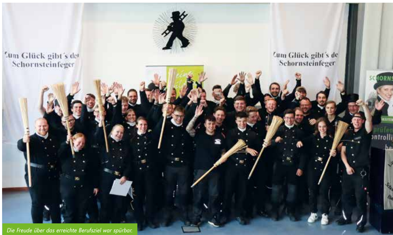
Die Freude über das erreichte Berufsziel war spürbar.