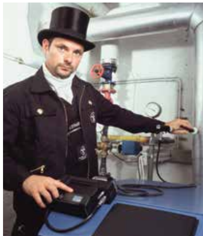
Vor 25 Jahren brachte Wöhler das robuste A 97 auf den Markt, mit dem Schornsteinfeger oft über viele Jahre gemessen haben.

Bereits 1964 verlegte Wöhler seinen Unternehmenssitz von Wuppertal an den jetzigen Standort, wo die Geräte noch heute entwickelt und produziert werden. Von hier aus wurden in den vergangenen Jahrzehnten eine ganze Reihe von Innovationen auf den Markt gebracht, die die Arbeit des Schornsteinfegers deutlich vereinfachten: Beispiele sind die Wöhler Haspeln mit Glasfaserstangen sowie Biegewellen, die mit der Bohrmaschine oder dem Akuschrauber zum Rotieren gebracht werden. Viele erinnern sich ebenso an das Wöhler A 600 als erstes Abgasmessgerät mit kabelloser Datenübertragung (2006). Mit dem Wöhler A 400 Abgasmessgerät wurde dann der 4-Pa-Test zum Nachweis ausreichender Verbrennungsluft sowie der Heizungs-Check eingeführt. Im Jahr 2013 präsentierte Wöhler das erste Staubmessgerät, das alle Messergebnisse online anzeigt (Wöhler SM 500).