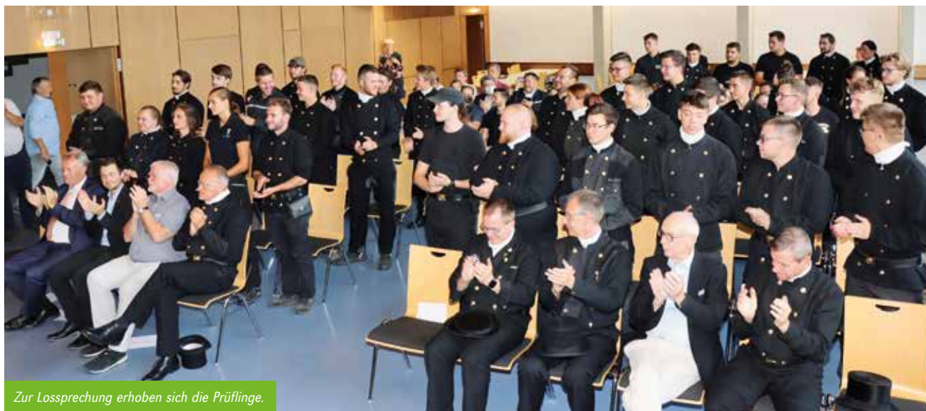
Zur Lossprechung erhoben sich die Prüflinge.

Infos siehe Augustausgabe dieser Fachzeitung.