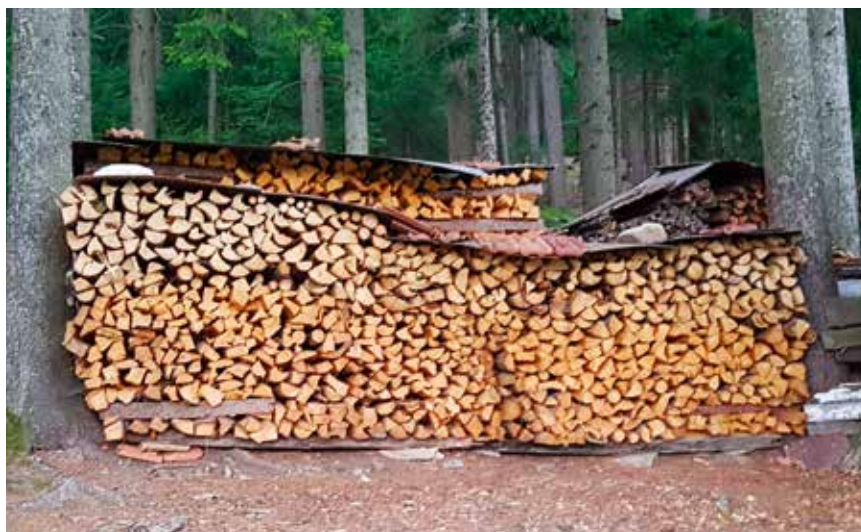
Gestapeltes Holz wird in Raummetern verkauft.